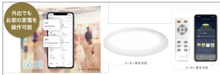
シーリングライトプロ