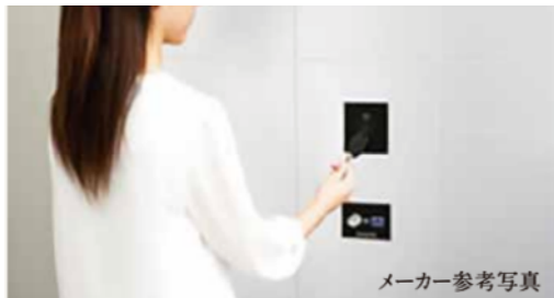
非接触キー対応 宅配ボックス

本物件は非接触キー対応の宅配ボックスやエントランスを採用しました。電気自動車の普及にあわせて「TERRA CHARGE (テラチャージ)」のEVコンセントを敷地内に4台分ご用意。また、出勤やショッピングなどの移動をより快適にお過ごしいただけるよう、電動キックボードや電動アシスト自転車、自動車シェアリングサービスの導入を予定しております。