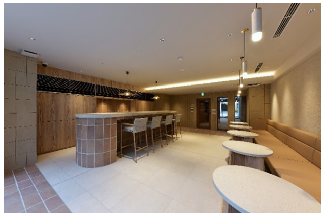
コワーキングラウンジ「the Node (ザ・ノード)」竣工写真

※掲載の所要時間は通勤時(7:30~9:00 着)の目的地駅への最多所要時間です。電車の所要時間は時間帯により異なります。