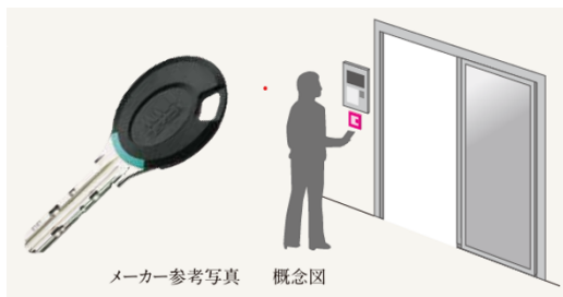
非接触キー対応 共用エントランス