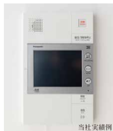
カラーモニター付き ハンズフリーインターフォン