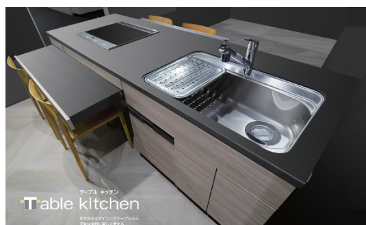
テーブルキッチン

※掲載の写真や概念図は実績例およびメーカー参考写真で、色調など実際とは異なる場合がございます。詳しくは本物件のモデルルームでご確認ください。